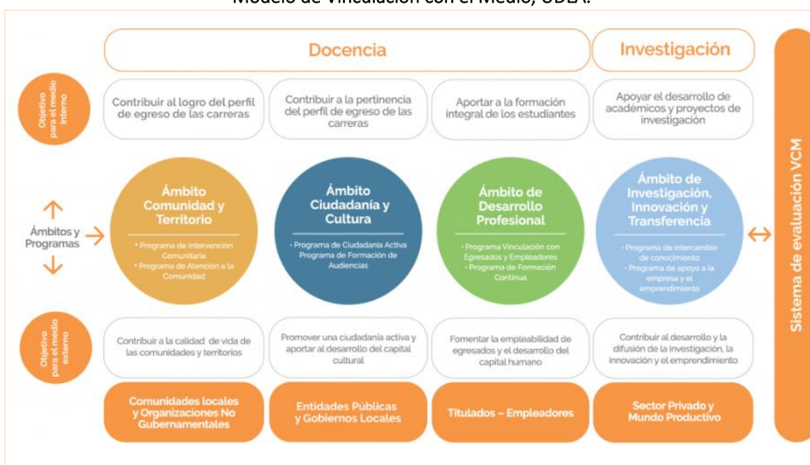
Modelo de Vinculación con el Medio, UDLA.

Es en estos ámbitos de interacción que se desarrollan los ocho programas que acogen a los diversos proyectos que llevan adelante las facultades desde sus distintas disciplinas y en los diversos territorios con que UDLA se vincula.